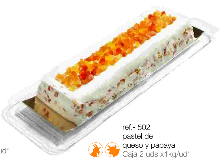
ref.- 502 pastel de queso y papaya Caja 2 uds x1kg/ud*