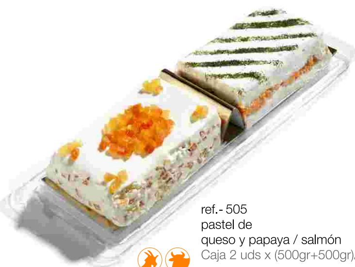
ref.- 505 pastel de queso y papaya / salmón Caja 2 uds x (500gr+500gr)/ud*