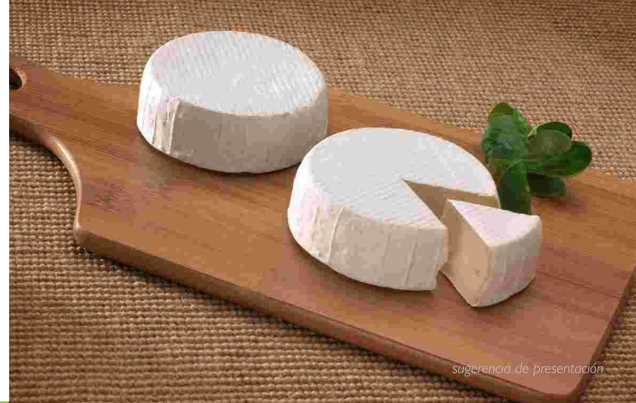
sugerencia de presentación