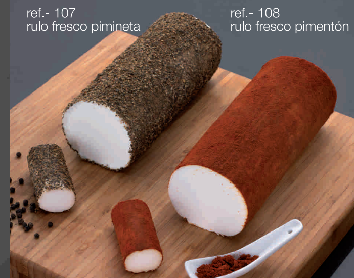
ref.- 107 rulo fresco pimineta