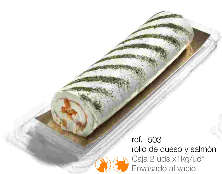
ref.- 503 rollo de queso y salmón Caja 2 uds x1kg/ud* Envasado al vacío