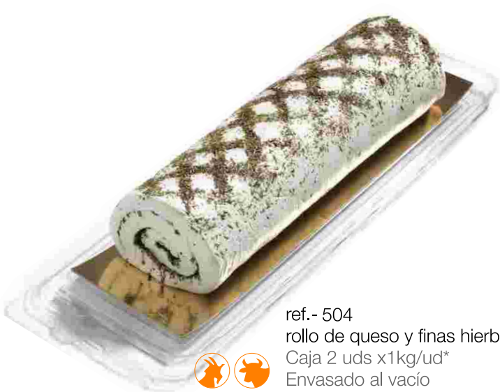
ref.- 504 rollo de queso y finas hierbas Caja 2 uds x1kg/ud* Envasado al vacío