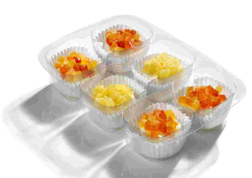
ref.- 211 bocaditos: papaya y piña / papaya Caja 9 bandejas x (6x25gr)*