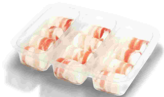
ref.- 204 rulitos de queso y bacon Caja 9 bandejas x (12x25gr)*