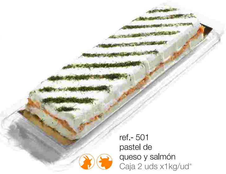
ref.- 501 pastel de queso y salmón Caja 2 uds x1kg/ud*