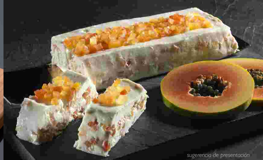
sugerencia de presentación