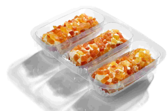
ref.- 209 rulitos de papaya y piña Caja 9 bandejas x (3x85gr)*