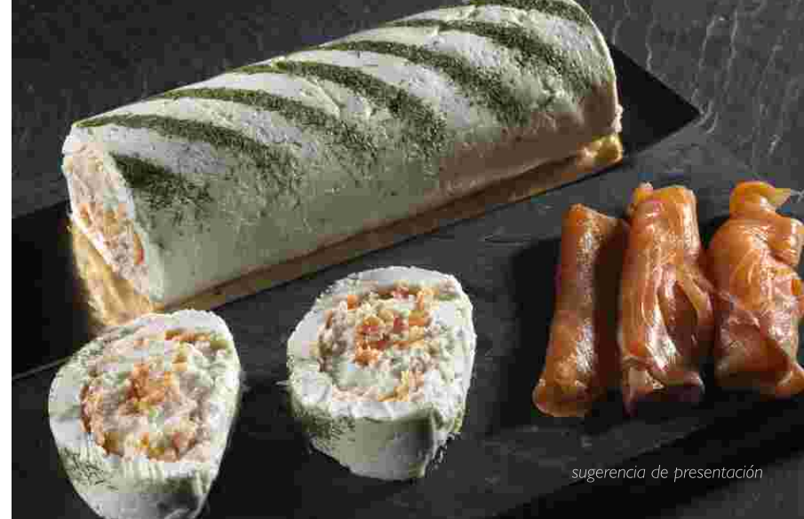
sugerencia de presentación