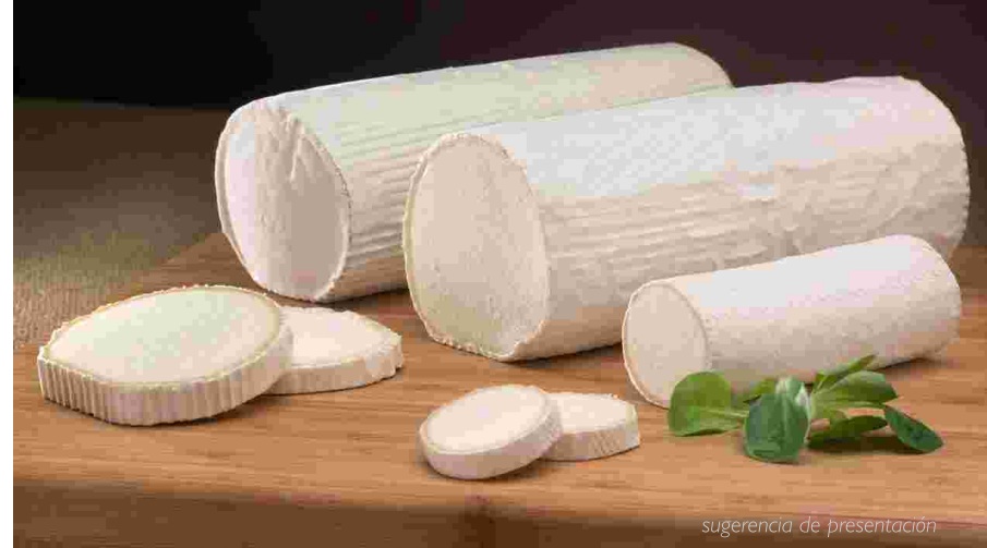
sugerencia de presentación