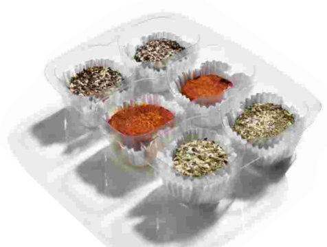
ref.- 210 bocaditos: pimienta negra, pimentón y finas hierbas Caja 9 bandejas x (6x25gr)*