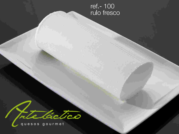
ref.- 100 rulo fresco