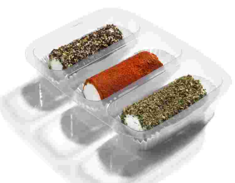
ref.- 202 rulitos: pimienta negra, pimentón y finas hierbas Caja 9 bandejas x (3x60gr)*