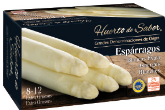
Código: 6489 Espárragos 8-12 Extra Lata 1 kg Bajo EAN13: 8436006916489