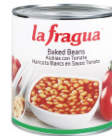
Código: 7653 Baked Beans (Alubias con Tomate) Lata 3 kg EAN13: 8436006917653