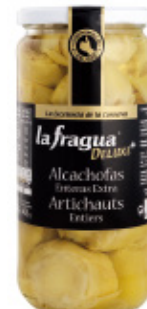
Código: 2276 Alcachofa Entera Extra Tarro-720 EAN13: 8436006912276