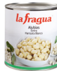
Código: 2924 Alubias Blancas Extra Lata 3 kg EAN13: 8436006912924