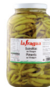
Código: 1057 Guindillas en Vinagre I Tarro Galón EAN13: 8436006911057