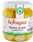
Código: 5659 Dientes de Ajos en Oliva Extra Tarro-370 EAN13: 8436006915659