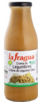
Código: 7387 Crema de Legumbres Botella 1/2 L EAN13: 8436006917387