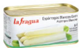
Código: 0494 Espárragos 6-8 Extra Lata 1 kg Bajo EAN13: 8436006910494