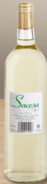
Código: 2207 Vino Blanco Tirilla Botella 3/4 L. 11,5% Vol. EAN13: 8436006912207