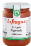
Código: 1484 Fritada-Piperrada Extra Tarro-445 EAN13: 8436006911484