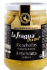
Código: 4379 Alcachofa Entera Extra Tarro-445 EAN13: 8436006914379