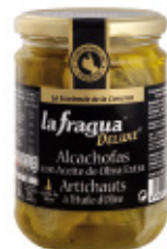
Código: 0005 Alcachofa Entera 10-12 en Aceite de Oliva Extra Tarro-445 EAN13: 8436006910005