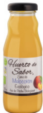
Código: 7349 Zumo de Melocotón Ecológico Botella 200 ml EAN13: 8436006917349