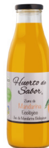
Código: 7042 Zumo de Mandarina Ecológico Botella 3/4 L EAN13: 8436006917042