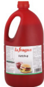
Código: 6939 Ketchup Garrafa 1850 g EAN13: 8436006916939