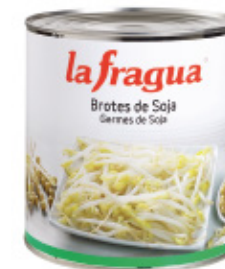
Código: 6434 Brotes de Soja I Lata 3 kg EAN13: 8436006916434