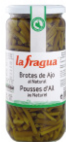
Código: 2023 Brotes de Ajos Verdes al Natural Extra Tarro-720 EAN13: 8436006912023