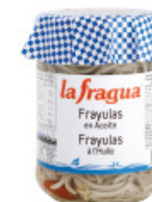
Código: 1132 Frayulas al Ajillo en Aceite Tarro-445 EAN13: 8436006911132