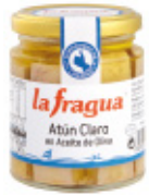
Código: 1262 Atún Claro en Aceite de Oliva Tarro-250 EAN13: 8436006911262