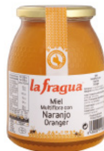
Código: 1958 Miel de Naranja Tarro 1 kg EAN13: 8436006911958