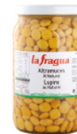
Código: 5833 Altramuces I Tarro 1/2 Galón EAN13: 8436006915833