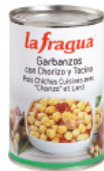
Código: 2450 Garbanzos con Chorizo y Tocino Extra Lata 1/2 kg EAN13: 8436006912450