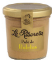
Código: 6670 Paté de Boletus Tarro-100 EAN13: 8436006916670