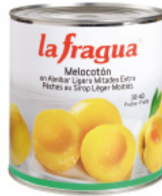
Código: 3044 Melocotón en Almíbar Mitades 30-40 Extra Lata 3 kg EAN13: 8436006913044