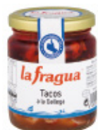
Código: 3600 Tacos a la Gallega en Aceite Tarro-250 EAN13: 8436006913600