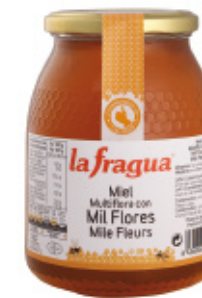
Código: 1231 Miel Mil Flores Tarro 1 kg EAN13: 8436006911231