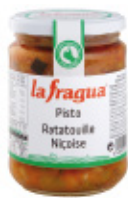
Código: 1637 Pisto Cocinado Extra Tarro-445 EAN13: 8436006911637