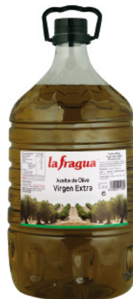
Código: 1804 Aceite de Oliva Virgen Extra Pet 5 L EAN13: 8436006911804