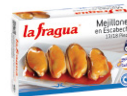
Código: 6816 Mejillones 13-18 en Escabeche Lata OL-120 EAN13: 8436006916816