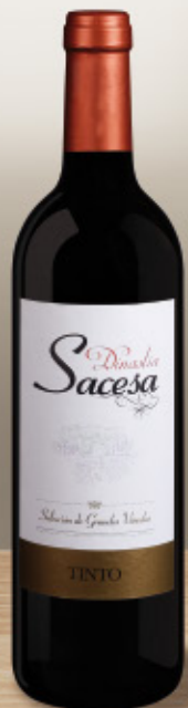
Código: 2368 Vino Tinto Crianza (Roble) Botella 3/4 L. 14% Vol. EAN13: 8436006912368