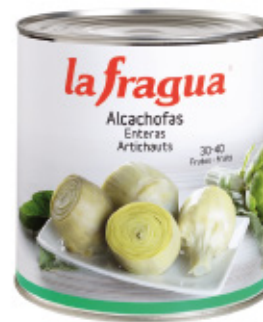
Código: 4928 Alcachofa Entera 30-40 Extra Lata 3 kg EAN13: 8436006914928