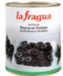
Código: 6984 Aceitunas Negras en Rodajas l Lata 3 kg (A10) EAN13: 8436006916984