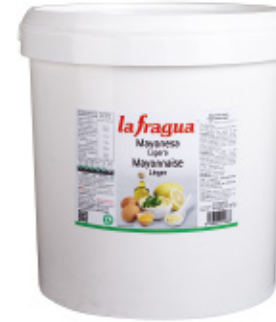
Código: 5888 Mayonesa Ligera Extra Cubo 10000 ml EAN13: 8436006915888