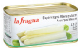
Código: 1163 Espárragos 17-24 Extra Lata 1 kg Bajo EAN13: 8436006911163