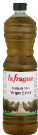
Código: 1811 Aceite de Oliva Virgen Extra Pet 1 L EAN13: 8436006911811