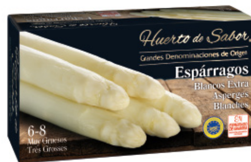
Código: 6496 Espárragos 6-8 Extra Lata 1/2 kg EAN13: 8436006916496