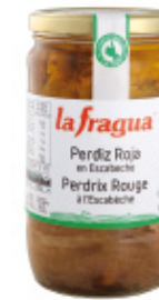
Código: 3921 Perdiz Roja en Escabeche Extra Tarro-720 EAN13: 8436006913921