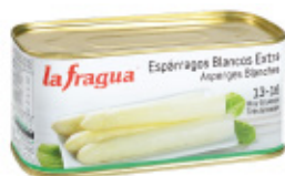
Código: 0470 Espárragos 13-16 Extra Lata 1 kg Bajo EAN13: 8436006910470