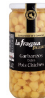
Código: 3433 Garbanzos Extra Tarro-720 EAN13: 8436006913433