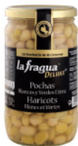
Código: 0043 Pochas Blancas y Verdes Extra Tarro-720 EAN13: 8436006910043