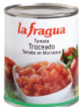
Código: 5925 Tomate Troceado (Dados) Natural I Lata 1 kg EAN13: 8436006915925