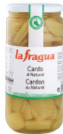
Código: 0845 Cardo al Natural Extra Tarro-720 EAN13: 8436006910845