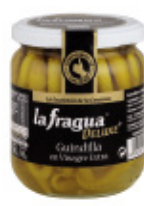
Código: 2696 Guindilla-Piparra Vasca en Vinagre Extra Tarro-370 EAN13: 8436006912696