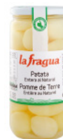
Código: 2115 Patata Entera al Natural Extra Tarro-720 EAN13: 8436006912115