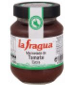
Código: 7592 Mermelada de Tomate Extra Tarro-314 EAN13: 8436006917592