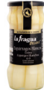
Código: 6465 Espárragos 6-9 Extra Tarro-580 EAN13: 8436006916465