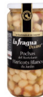
Código: 3396 Pochas del Hortelano Extra Tarro-720 EAN13: 8436006913396