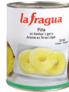
Código: 3020 Piña en Almíbar Ligero Rodajas 50-60 l Lata 3 kg EAN13: 8436006913020