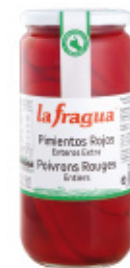
Código: 2245 Pimiento Morrón Entero Extra Tarro-720 EAN13: 8436006912245