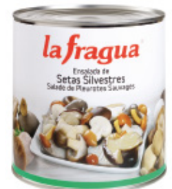
Código: 3969 Ensalada de Setas Silvestres I Lata 3 kg EAN13: 8436006913969