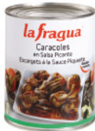
Código: 0517 Caracoles en Salsa Picante Extra Lata 1 kg EAN13: 8436006910517