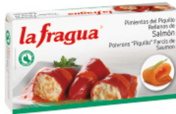
Código: 0616 Pimientos Rellenos de Salmón Lata 1/4 kg Fiesta Alto EAN13: 8436006910616