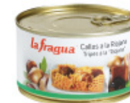
Código: 2498 Callos a la Riojana Extra Lata 1/2 kg EAN13: 8436006912498