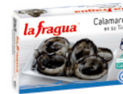
Código: 3129 Calamares en su Tinta Lata OL-120 EAN13: 8436006913129