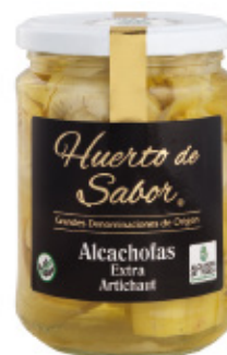
Código: 6533 Alcachofa Entera Extra Tarro-445 EAN13: 8436006916533