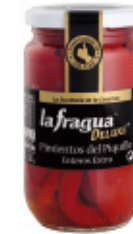
Código: 6397 Pimiento Piquillo Enteros Extra Tarro-370 EAN13: 8436006916397