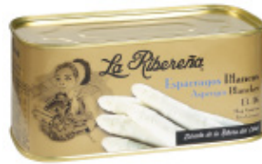
Código: 6205 Espárragos 13-16 l Lata 1 kg Bajo EAN13: 8436006916205