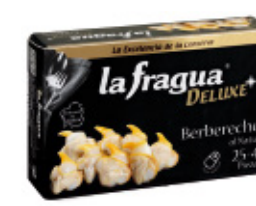
Código: 5987 Berberechos 25-40 al Natural Lata OL-120 EAN13: 8436006915987