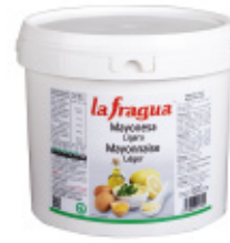
Código: 3495 Mayonesa Ligera Extra Cubo 3600 ml EAN13: 8436006913495