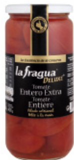
Código: 0128 Tomate Entero Natural Extra Tarro-720 EAN13: 8436006910128