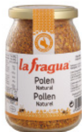
Código: 3631 Polen Tarro 1/2 kg EAN13: 8436006913631