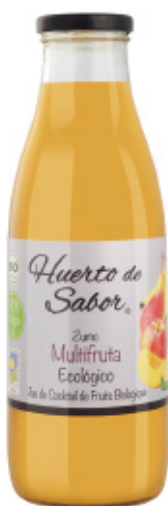
Código: 7219 Zumo Multifruta Ecológico Botella 3/4 L EAN13: 8436006917219