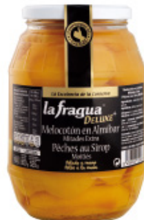
Código: 0036 Melocotón en Almibar Mitades Artesano Extra Tarro-1000 EAN13: 8436006910036