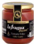
Código: 3228 Tomate Frito con Aceite de Oliva Extra Estilo Casero Tarro-370 EAN13: 8436006913228