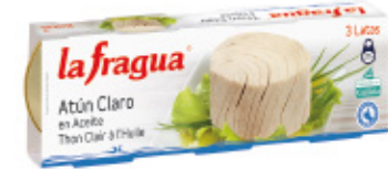
Código: 4072 Atún Claro en Aceite Lata RO-85 Pack-3 EAN13: 8436006914072