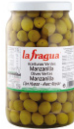
Código: 3457 Aceitunas Manzanilla 161/200 l Tarro 1/2 Galón EAN13: 8436006913457