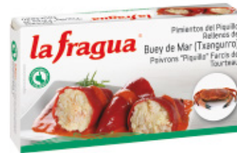
Código: 5123 Pimientos Rellenos de Buey de Mar Lata 1/4 kg Fiesta Alto EAN13: 8436006915123