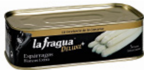
Código: 6243 Espárragos 5 Frutos Extra Lata 1/2 kg EAN13: 8436006916243