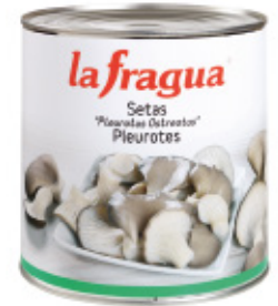
Código: 3983 Setas Cultivo ( Pleurotus Ostreatus ) I Lata 3 kg EAN13: 8436006913983