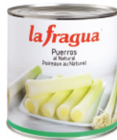
Código: 6915 Puerros Enteros al Natural I Lata 3 kg EAN13: 8436006916915