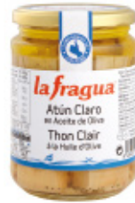
Código: 2825 Atún Claro en Aceite de Oliva Tarro-445 EAN13: 8436006912825