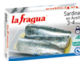
Código: 7585 Sardinias 3-4 en Aceite Lata RR-125 EAN13: 8436006917585