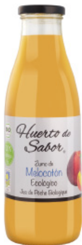
Código: 7073 Zumo de Melocotón Ecológico Botella 3/4 L EAN13: 8436006917073