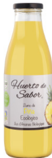
Código: 7103 Zumo de Piña Ecológico Botella 3/4 L EAN13: 8436006917103