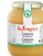
Código: 6878 Compota de Manzana Tarro-720 EAN13: 8436006916878