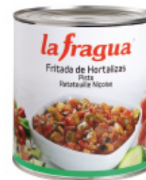
Código: 5512 Fritada de Hortalizas (Pisto) Lata 3 kg EAN13: 8436006915512