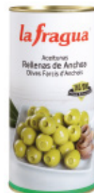
Código: 5338 Aceitunas Rellenas de Anchoa 161/200 l Lata 2 kg EAN13: 8436006915338