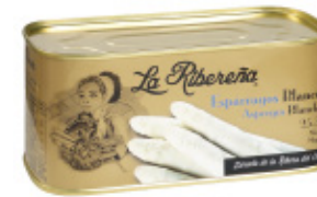
Código: 6236 Espárragos 25-34 l Lata 1 kg Bajo EAN13: 8436006916236