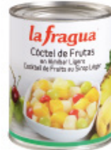
Código: 3235 Cóctel 5 Frutas en Almíbar Ligero l Lata 1 kg EAN13: 8436006913235