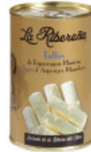
Código: 6366 Tallos de Espárragos l Lata 1/2 kg EAN13: 8436006916366