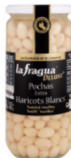
Código: 3426 Pochas Extra Tarro-720 EAN13: 8436006913426