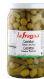
Código: 3440 Cocktail Sabor Anchoa I Tarro 1/2 Galón EAN13: 8436006913440