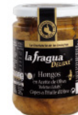
Código: 2764 Hongos ( Boletus Edulis ) en Aceite de Oliva I Tarro-445 EAN13: 8436006912764