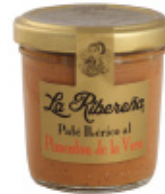
Código: 6649 Paté Ibérico al Pimentón de la Vera Tarro-100 EAN13: 8436006916649