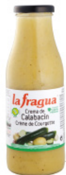
Código: 6762 Crema de Calabacín Botella 1/2 L EAN13: 8436006916762