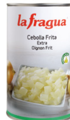
Código: 6632 Cebolla Frita en Aceite de Oliva Extra Lata 5 kg EAN13: 8436006916632