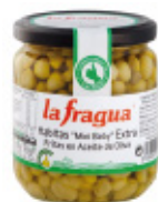
Código: 1651 Habitas Fritas Mini Baby en Aceite de Oliva Extra Tarro-370 EAN13: 8436006911651