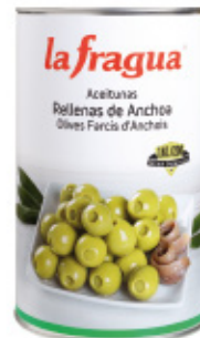
Código: 5444 Aceitunas Rellenas de Anchoa 161/200 l Lata 5 kg EAN13: 8436006915444