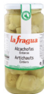
Código: 6045 Alcachofa Entera 14-20 I Tarro-720 EAN13: 8436006916045