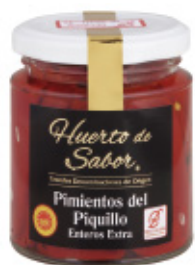
Código: 6519 Pimiento Piquillo Entero Extra Tarro-250 EAN13: 8436006916519