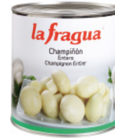
Código: 0746 Champiñón Entero I Lata 3 kg EAN13: 8436006910746