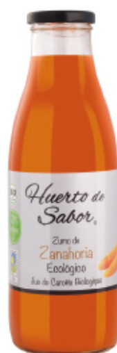
Código: 7134 Zumo de Zanahoria Ecológico Botella 3/4 L EAN13: 8436006917134