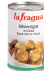
Código: 4850 Albóndigas en Salsa Extra Lata 1/2 kg EAN13: 8436006914850