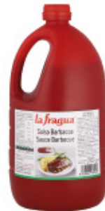
Código: 6960 Salsa Barbacoa Garrafa 1850 g EAN13: 8436006916960