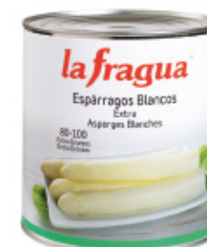
Código: 5970 Espárragos 80-100 Extra Lata 3 kg EAN13: 8436006915970