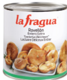
Código: 3976 Rovellón Entero ( Lactarius Deliciosus ) Extra Lata 3 kg EAN13: 8436006913976