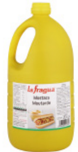
Código: 3747 Mostaza Garrafa 1850 g EAN13: 8436006913747