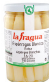
Código: 5642 Espárragos 16-20 Extra Tarro-1000 EAN13: 8436006915642