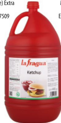
Código: 6946 Ketchup Garrafa 4850 g EAN13: 8436006916946