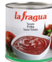
Código: 0302 Tomate Frito Extra Lata 3 kg EAN13: 8436006910302