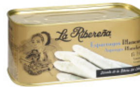
Código: 6229 Espárragos 17-24 l Lata 1 kg Bajo EAN13: 8436006916229