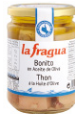
Código: 1279 Bonito en Aceite de Oliva Tarro-445 EAN13: 8436006911279