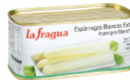
Código: 5390 Espárragos 25-34 Extra Lata 1 kg Bajo EAN13: 8436006915390