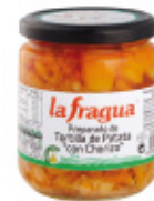
Código: 6137 Preparado de Tortilla de Patata con Chorizo Tarro-370 EAN13: 8436006916137