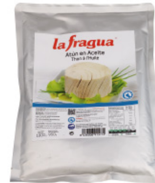
Código: 5772 Atún en Aceite Bolsa 1 kg EAN13: 8436006915772