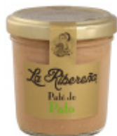
Código: 6328 Paté de Pato Tarro-100 EAN13: 8436006916328