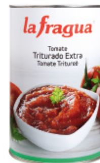
Código: 3310 Tomate Triturado Natural Extra Lata 5 kg EAN13: 8436006913310