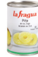
Código: 3570 Piña en su Jugo Rodajas 8-10 l Lata 3/4 kg EAN13: 8436006913570