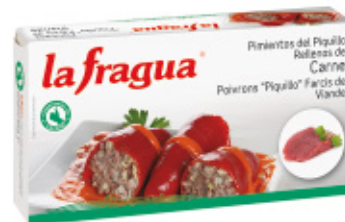
Código: 0586 Pimientos Rellenos de Carne Lata 1/4 kg Fiesta Alto EAN13: 8436006910586