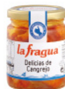
Código: 4089 Delicias de Cangrejo en Aceite Tarro-250 EAN13: 8436006914089