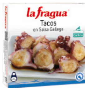
Código: 3655 Tacos a la Gallega en Aceite Lata R0-280 EAN13: 8436006913655