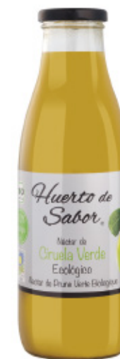
Código: 7196 Néctar de Ciruela Verde Ecológico Botella 3/4 L EAN13: 8436006917196