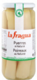
Código: 0876 Puerros Enteros 7-9 al Natural Extra Tarro-720 EAN13: 8436006910876