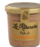
Código: 6694 Paté de Secreto Ibérico Tarro-100 EAN13: 8436006916694