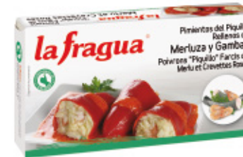
Código: 0579 Pimientos Rellenos de Merluza y Gambas Lata 1/4 kg Fiesta Alto EAN13: 8436006910579