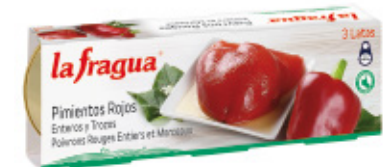
Código: 5963 Pimiento Piquillo Entero y Trozo Lata 1/8 kg Pack-3 EAN13: 8436006915963