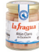
Código: 2559 Atún Claro en Escabeche Tarro-250 EAN13: 8436006912559