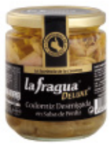
Código: 0050 Codorniz Desmigada en Salsa de Perdiz Tarro-370 EAN13: 8436006910050