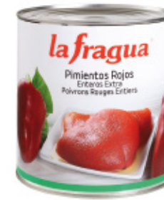
Código: 0401 Pimiento Morrón Entero Extra Lata 3 kg EAN13: 8436006910401