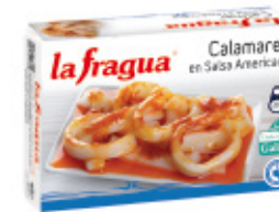
Código: 3112 Calamares en Salsa Americana Lata OL-120 EAN13: 8436006913112