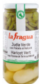
Código: 3341 Judía Verde con Patata al Natural Extra Tarro-720 EAN13: 8436006913341