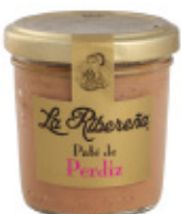
Código: 6656 Paté de Perdiz Tarro-100 EAN13: 8436006916656