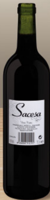
Código: 2191 Vino Tinto Joven Tirilla Botella 3/4 L. 13% Vol. EAN13: 8436006912191