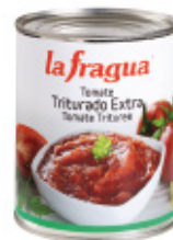
Código: 0203 Tomate Triturado Natural Extra Lata 1 kg EAN13: 8436006910203