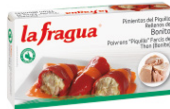
Código: 0562 Pimientos Rellenos de Bonito del Norte Lata 1/4 kg Fiesta Alto EAN13: 8436006910562