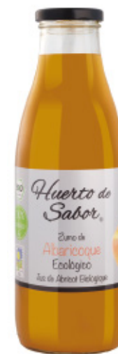
Código: 7189 Zumo de Albahorque Ecológico Botella 3/4 L EAN13: 8436006917189