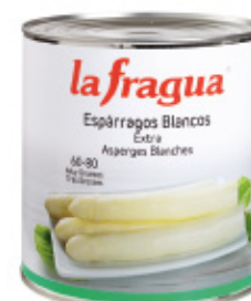
Código: 6557 Espárragos 60-80 Extra Lata 3 kg EAN13: 8436006916557