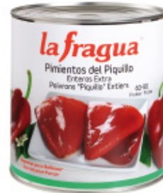
Código: 1842 Pimiento Piquillo Entero 60-80 Extra Lata 3 kg EAN13: 8436006911842