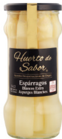
Código: 7325 Espárragos 9-12 Extra Tarro-580 EAN13: 8436006917325