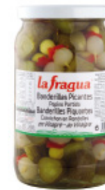
Código: 1552 Banderillas Picantes Pepino Partido I Tarro 1/2 Galón EAN13: 8436006911552