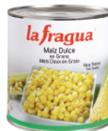
Código: 3754 Maíz Dulce en Grano I Lata 3 kg EAN13: 8436006913754