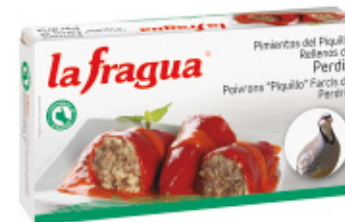
Código: 5130 Pimientos Rellenos de Perdiz Lata 1/4 kg Fiesta Alto EAN13: 8436006915130