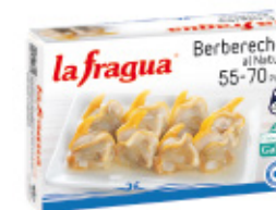
Código: 5314 Berberechos 55-70 al Natural Lata OL-120 EAN13: 8436006915314