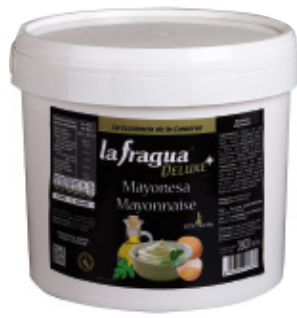
Código: 3686 Mayonesa (65% Aceite) Extra Cubo 3600 ml EAN13: 8436006913686