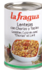
Código: 2467 Lentejas con Chorizo y Tocino Extra Lata 1/2 kg EAN13: 8436006912467