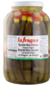
Código: 1415 Banderillas Dulces Pepino Entero I Tarro Galón EAN13: 8436006911415