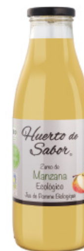
Código: 7066 Zumo de Manzana Ecológico Botella 3/4 L EAN13: 8436006917066