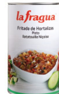
Código: 6311 Fritada de Hortalizas (Pisto) Extra Lata 5 kg EAN13: 8436006916311