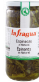
Código: 0784 Espinacas al Natural Extra Tarro-720 EAN13: 8436006910784