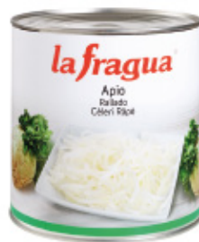
Código: 6441 Apio Rallado I Lata 3 kg EAN13: 8436006916441