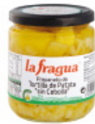
Código: 6106 Preparado de Tortilla de Patata Tarro-370 EAN13: 8436006916106