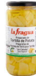
Código: 7394 Preparado de Tortilla de Patata Tarro-720 EAN13: 8436006917394