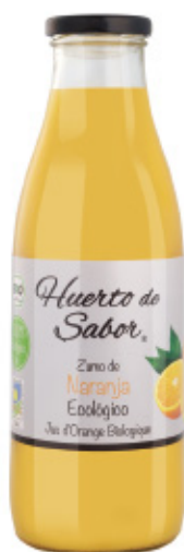
Código: 7080 Zumo de Naranja Ecológico Botella 3/4 L EAN13: 8436006917080