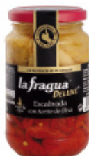
Código: 0029 Escalivada Artesana Extra Tarro-370 EAN13: 8436006910029