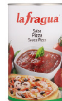
Código: 6304 Salsa Pizza I Lata 5 kg EAN13: 8436006916304