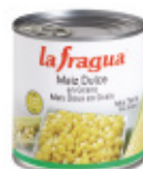
Código: 2740 Maíz Dulce en Grano I Lata 1/2 kg EAN13: 8436006912740