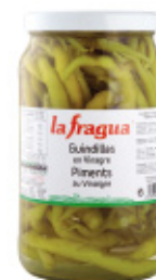
Código: 1088 Guindillas en Vinagre I Tarro 1/2 Galón EAN13: 8436006911088