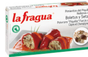
Código: 0609 Pimientos Rellenos de Boletus y Setas Lata 1/4 kg Fiesta Alto EAN13: 8436006910609