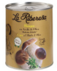
Código: 0944 Hongos ( Boletus Edulis ) en Aceite de Oliva l Lata 1 kg EAN13: 8436006910944