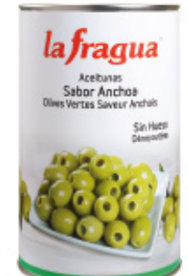
Código: 0692 Aceitunas Sabor Anchoa sin Hueso 241/260 l Lata 5 kg EAN13: 8436006910692