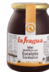
Código: 1972 Miel de Eucalipto Tarro 1 kg EAN13: 8436006911972