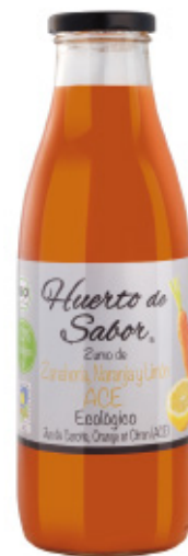
Código: 7172 Zumo ACE Ecológico Botella 3/4 L EAN13: 8436006917172