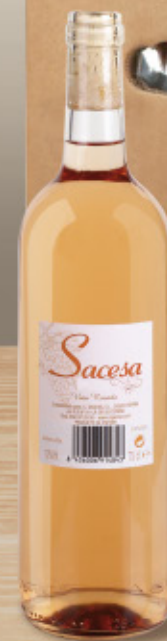
Código: 4843 Vino Clarete Tirilla Botella 3/4 L. 12% Vol. EAN13: 8436006914843