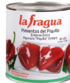
Código: 1859 Pimiento Piquillo Entero 80-100 Extra Lata 3 kg EAN13: 8436006911859