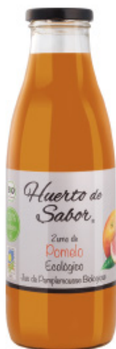
Código: 7226 Zumo de Pomelo Ecológico Botella 3/4 L EAN13: 8436006917226