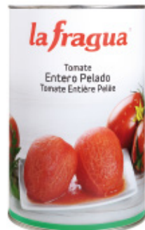
Código: 2122 Tomate Entero Natural I Lata 5 kg EAN13: 8436006912122