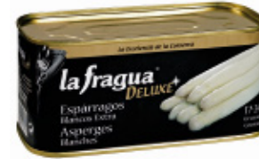
Código: 6212 Espárragos 17-24 Extra Lata 1 kg Bajo EAN13: 8436006916212