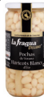
Código: 3389 Pochas de Verano Extra Tarro-720 EAN13: 8436006913389