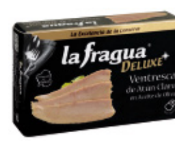
Código: 5468 Ventresca de Atún Claro en Aceite de Oliva Lata RR-125 EAN13: 8436006915468