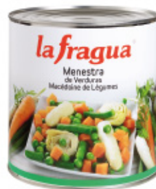
Código: 3037 Menestra de Verduras al Natural I Lata 3 kg EAN13: 8436006913037