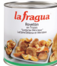
Código: 5482 Rovellón Trozos ( Lactarius Deliciosus ) I Lata 3 kg EAN13: 8436006915482