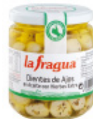
Código: 5666 Dientes de Ajos en Oliva con Hierbas Extra Tarro-370 EAN13: 8436006915666