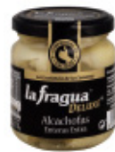
Código: 2269 Alcachofa Entera Baby 15-20 Extra Tarro-212 EAN13: 8436006912269