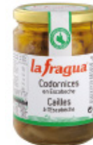
Código: 1477 Codornices en Escabeche Extra Tarro-445 EAN13: 8436006911477