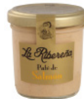
Código: 7165 Paté de Salmón Tarro-100 EAN13: 8436006917165