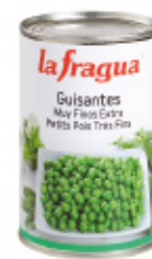
Código: 1897 Guisantes Muy Finos al Natural Extra Lata 1/2 kg EAN13: 8436006911897