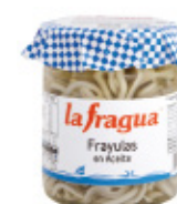
Código: 1149 Frayulas al Ajillo en Aceite Tarro-250 EAN13: 8436006911149