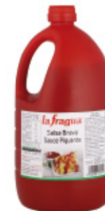
Código: 7417 Salsa Brava Garrafa 1850 g EAN13: 8436006917417