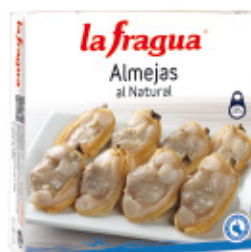
Código: 5413 Almejas al Natural Lata R0-120 EAN13: 8436006915413