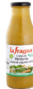
Código: 6786 Crema de Verduras Botella 1/2 L EAN13: 8436006916786