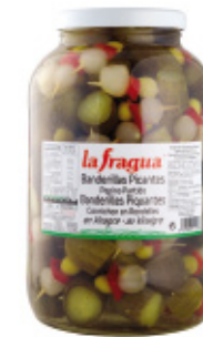
Código: 1538 Banderillas Picantes Pepino Partido I Tarro Galón EAN13: 8436006911538