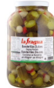
Código: 1422 Banderillas Dulces Pepino Partido I Tarro Galón EAN13: 8436006911422