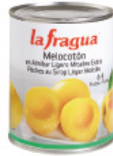
Código: 0074 Melocotón en Almíbar Mitades 6-8 Extra Lata 1 kg EAN13: 8436006910074