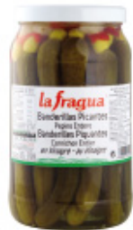
Código: 1545 Banderillas Picantes Pepino Entero I Tarro 1/2 Galón EAN13: 8436006911545