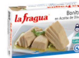
Código: 4201 Bonito en Aceite de Oliva Lata OL-120 EAN13: 8436006914201