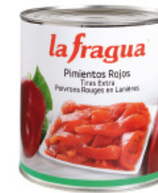
Código: 0432 Pimiento Morrón Tiras Extra Lata 3 kg EAN13: 8436006910432