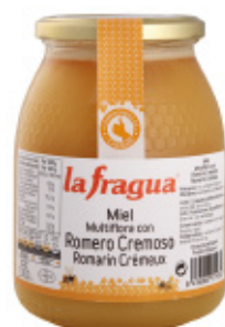
Código: 1934 Miel de Romero Cremoso Tarro 1 kg EAN13: 8436006911934