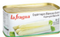
Código: 0487 Espárragos 8-12 Extra Lata 1 kg Bajo EAN13: 8436006910487