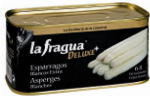
Código: 6472 Espárragos 6-8 Extra Lata 1 kg Alto EAN13: 8436006916472

Producto Nacional Premium la fragua ® DELUXE +