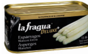
Código: 6199 Espárragos 13-16 Extra Lata 1 kg Bajo EAN13: 8436006916199