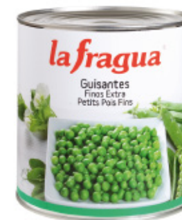
Código: 2955 Guisantes Finos al Natural Extra Lata 3 kg EAN13: 8436006912955