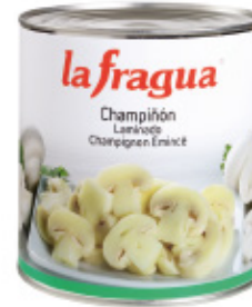
Código: 0739 Champiñón Laminado I Lata 3 kg EAN13: 8436006910739