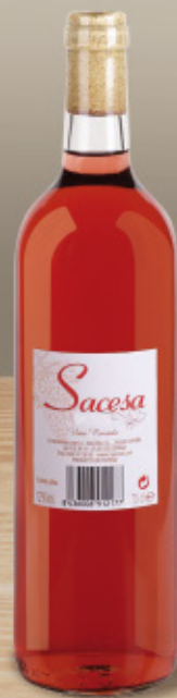
Código: 2177 Vino Rosado Tirilla Botella 3/4 L. 13% Vol. EAN13: 8436006912177