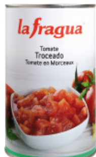
Código: 5352 Tomate Troceado (Dados) Natural I Lata 5 kg EAN13: 8436006915352