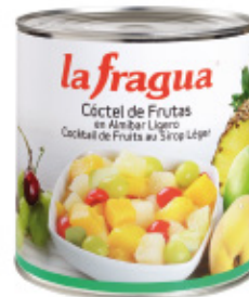
Código: 3051 Cóctel 5 Frutas en Almíbar Ligero l Lata 3 kg EAN13: 8436006913051