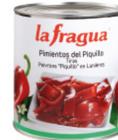
Código: 5529 Pimiento Piquillo Tiras I Lata 3 kg EAN13: 8436006915529