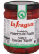
Código: 1606 Ensalada de Pimiento Piquillo I (Piquillo, Cebolla y Vinagre) Tarro-460 EAN13: 8436006911606