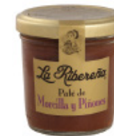
Código: 6663 Paté de Morcilla y Piñones Tarro-100 EAN13: 8436006916663