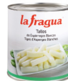
Código: 3075 Tallo de Espárragos Lata 3 kg EAN13: 8436006913075