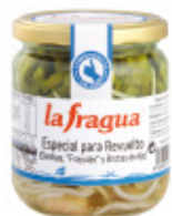
Código: 3303 Especial para Revuelto Extra Tarro-370 EAN13: 8436006913303