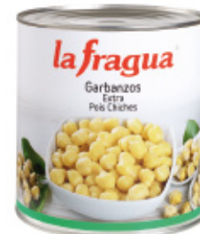
Código: 2931 Garbanzos Extra Lata 3 kg EAN13: 8436006912931