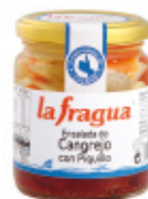
Código: 1781 Ensalada de Cangrejo con Piquillo en Aceite Tarro-250 EAN13: 8436006911781