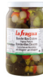
Código: 1446 Banderillas Dulces Pepino Partido I Tarro 1/2 Galón EAN13: 8436006911446