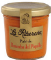
Código: 7141 Paté de Pimientos del Piquillo Tarro-100 EAN13: 8436006917141