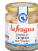
Código: 2214 Ensalada de Cangrejo con Frayulas en Aceite Tarro-250 EAN13: 8436006912214