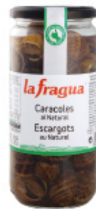
Código: 1699 Caracoles al Natural Extra Tarro-720 EAN13: 8436006911699