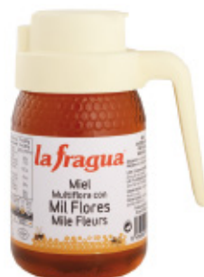
Código: 4461 Miel Mil Flores Dosificador-Jarra 1/2 kg EAN13: 8436006914461