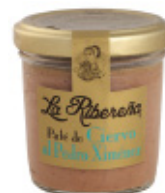
Código: 6687 Paté de Ciervo al Pedro Ximénez Tarro-100 EAN13: 8436006916687