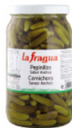
Código: 1071 Pepinillos Sabor Anchoa 300/400 I Tarro 1/2 Galón EAN13: 8436006911071