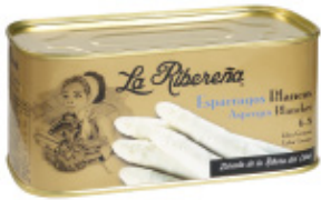
Código: 6168 Espárragos 6-8 l Lata 1 kg Bajo EAN13: 8436006916168