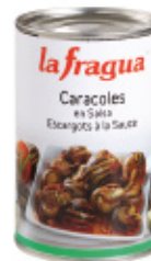
Código: 2412 Caracoles en Salsa Extra Lata 1/2 kg EAN13: 8436006912412