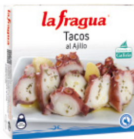
Código: 3662 Tacos al Ajillo en Aceite Lata R0-280 EAN13: 8436006913662