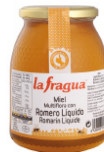
Código: 3280 Miel de Romero Liquido Tarro 1 kg EAN13: 8436006913280