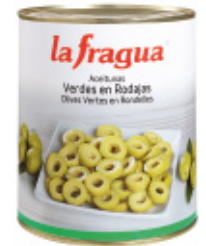
Código: 6977 Aceitunas Verdes en Rodajas l Lata 3 kg (A10) EAN13: 8436006916977