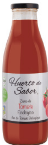
Código: 7233 Zumo de Tomate Ecológico Botella 3/4 L EAN13: 8436006917233