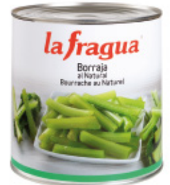
Código: 6830 Borraja al Natural Extra Lata 3 kg EAN13: 8436006916830