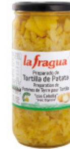
Código: 7400 Preparado de Tortilla de Patata con Cebolla Tarro-720 EAN13: 8436006917400