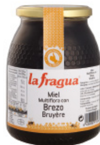
Código: 3266 Miel de Brezo Tarro 1 kg EAN13: 8436006913266