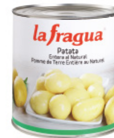
Código: 6922 Patata Entera al Natural I Lata 3 kg EAN13: 8436006916922