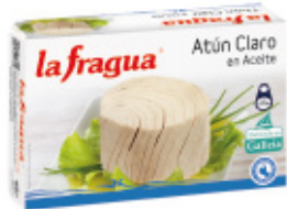
Código: 4003 Atún Claro en Aceite Lata OL-120 EAN13: 8436006914003