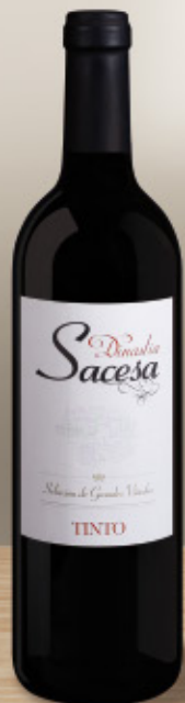
Código: 2832 Vino Tinto Joven Botella 3/4 L. 13% Vol. EAN13: 8436006912832