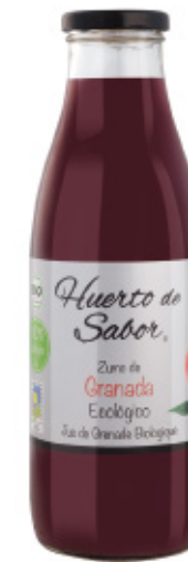
Código: 7035 Zumo de Granada Ecológico Botella 3/4 L EAN13: 8436006917035