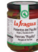
Código: 2252 Pimiento Piquillo Rojo y Verde Extra Tarro-460 EAN13: 8436006912252