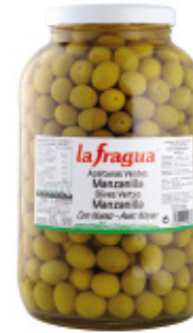
Código: 4683 Aceitunas Manzanilla 161/200 l Tarro Galón EAN13: 8436006914683