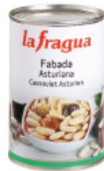
Código: 2443 Fabada Asturiana Extra Lata 1/2 kg EAN13: 8436006912443