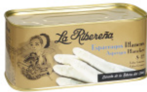
Código: 6182 Espárragos 8-12 l Lata 1 kg Bajo EAN13: 8436006916182