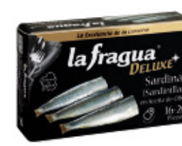
Código: 3211 Sardinillas 16-20 en Aceite de Oliva Lata RR-125 EAN13: 8436006913211