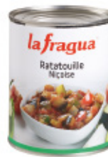
Código: 5093 Ratatouille Niçoise à l'Huile d'Olive Lata 1 kg EAN13: 8436006915093