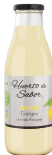
Código: 7202 Limonada Ecológica Botella 3/4 L EAN13: 8436006917202