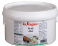
Código: 6953 Ali-Oli Cubo 1850 ml EAN13: 8436006916953