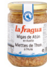
Código: 1286 Migas de Atún en Aceite Tarro-445 EAN13: 8436006911286