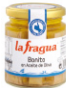
Código: 1255 Bonito en Aceite de Oliva Tarro-250 EAN13: 8436006911255