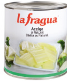
Código: 6823 Acelga al Natural Extra Lata 3 kg EAN13: 8436006916823