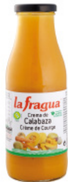
Código: 6779 Crema de Calabaza Botella 1/2 L EAN13: 8436006916779