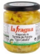
Código: 6113 Preparado de Tortilla de Patata con Cebolla Tarro-370 EAN13: 8436006916113