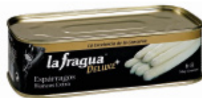
Código: 6250 Espárragos 6-8 Extra Lata 1/2 kg EAN13: 8436006916250