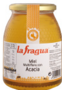
Código: 5086 Miel de Acacia Tarro 1 kg EAN13: 8436006915086