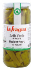
Código: 0883 Judía Verde Ancha al Natural Extra Tarro-720 EAN13: 8436006910883