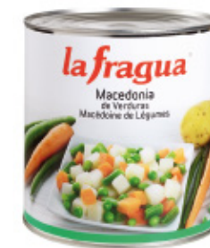
Código: 2979 Macedonia de Verduras al Natural Extra Lata 3 kg EAN13: 8436006912979