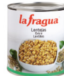
Código: 6014 Lentejas Extra Lata 3 kg EAN13: 8436006916014