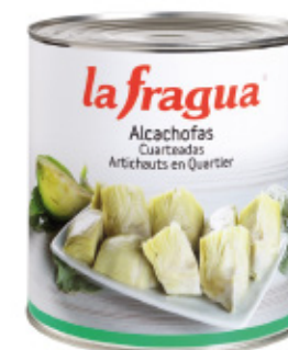
Código: 3952 Alcachofa Cuarteada I Lata 3 kg EAN13: 8436006913952