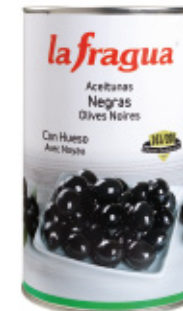
Código: 6892 Aceitunas Negras 241/260 l Lata 5 kg EAN13: 8436006916892