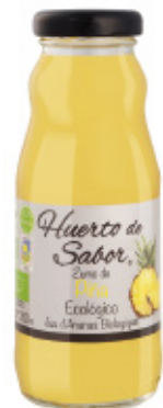
Código: 7363 Zumo de Piña Ecológico Botella 200 ml EAN13: 8436006917363