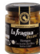
Código: 4560 Hongos ( Boletus Edulis ) en Aceite de Oliva I Tarro-250 EAN13: 8436006914560