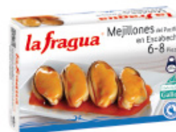
Código: 5437 Mejillones 6-8 en Escabeche Lata RR-125 EAN13: 8436006915437