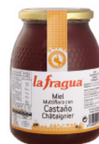
Código: 6021 Miel de Castaño Tarro 1 kg EAN13: 8436006916021