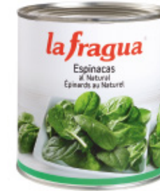
Código: 6854 Espinacas al Natural I Lata 3 kg EAN13: 8436006916854