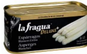
Código: 6175 Espárragos 8-12 Extra Lata 1 kg Bajo EAN13: 8436006916175