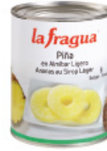
Código: 3013 Piña en Almíbar Ligero Rodajas 8-10 l Lata 1 kg EAN13: 8436006913013