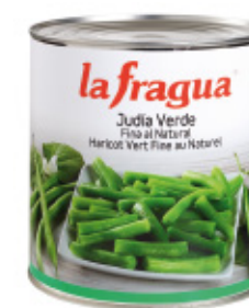
Código: 2993 Judía Verde Redonda-Fina al Natural I Lata 3 kg EAN13: 8436006912993