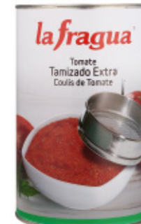
Código: 3242 Tomate Tamizado Natural Extra Lata 5 kg EAN13: 8436006913242