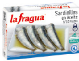
Código: 6809 Sardinillas 6-10 en Aceite Lata RR-90 EAN13: 8436006916809