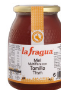
Código: 1910 Miel de Tomillo Tarro 1 kg EAN13: 8436006911910