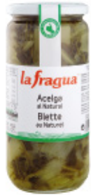
Código: 0869 Acelga al Natural Extra Tarro-720 EAN13: 8436006910869