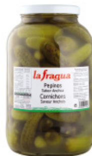
Código: 1064 Pepinos Sabor Anchoa 30/40 I Tarro Galón EAN13: 8436006911064