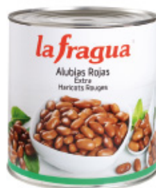
Código: 6427 Alubias Rojas Extra Lata 3 kg EAN13: 8436006916427