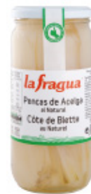
Código: 2986 Pencas de Acelga al Natural Extra Tarro-720 EAN13: 8436006912986