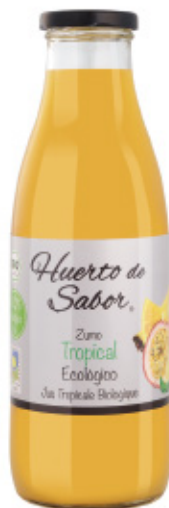
Código: 7110 Zumo Tropical Ecológico Botella 3/4 L EAN13: 8436006917110