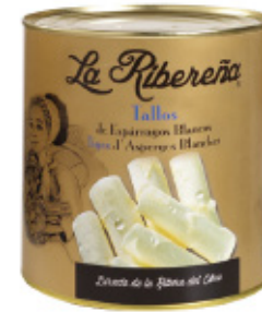
Código: 6281 Tallos de Espárragos l Lata 3 kg EAN13: 8436006916281