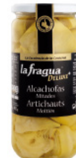
Código: 1026 Alcachofa Mitades I Tarro-720 EAN13: 8436006911026