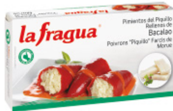
Código: 0593 Pimientos Rellenos de Bacalao Lata 1/4 kg Fiesta Alto EAN13: 8436006910593