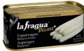
Código: 6151 Espárragos 6-8 Extra Lata 1 kg Bajo EAN13: 8436006916151