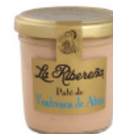
Código: 6717 Paté de Ventresca de Atún Tarro-100 EAN13: 8436006916717