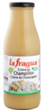
Código: 7370 Crema de Champiñón Botella 1/2 L EAN13: 8436006917370