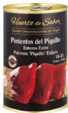
Código: 6526 Pimiento Piquillo Entero 18-22 Extra Lata 1/2 kg EAN13: 8436006916526