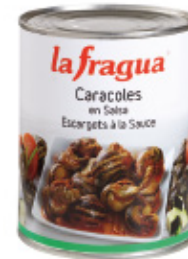
Código: 2429 Caracoles en Salsa Extra Lata 1 kg EAN13: 8436006912429