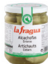
Código: 6410 Alcachofa Entera 10-14 I Tarro-460 EAN13: 8436006916410