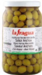
Código: 3464 Aceitunas Sabor Anchoa 161/200 l Tarro 1/2 Galón EAN13: 8436006913464