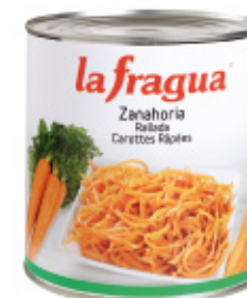
Código: 2900 Zanahoria Rallada I Lata 3 kg EAN13: 8436006912900