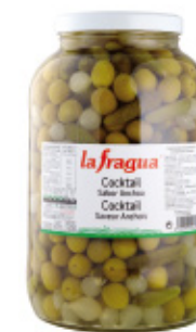
Código: 4690 Cocktail Sabor Anchoa I Tarro Galón EAN13: 8436006914690