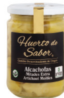
Código: 6540 Alcachofa Mitades Extra Tarro-445 EAN13: 8436006916540