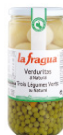
Código: 3365 Verduritas al Natural Extra Tarro-720 EAN13: 8436006913365