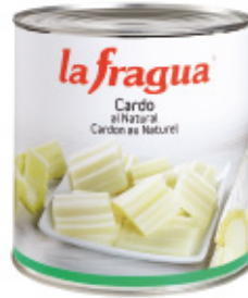
Código: 6847 Cardo al Natural Extra Lata 3 kg EAN13: 8436006916847