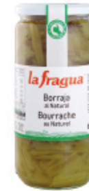
Código: 0852 Borraja al Natural Extra Tarro-720 EAN13: 8436006910852