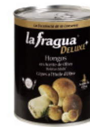
Código: 0463 Hongos ( Boletus Edulis ) en Aceite de Oliva I Lata 1kg EAN13: 8436006910463