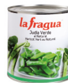
Código: 2962 Judía Verde Ancha al Natural I Lata 3 kg EAN13: 8436006912962