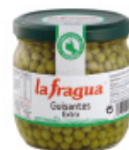
Código: 3259 Guisantes Extrafinos al Natural Extra Tarro-370 EAN13: 8436006913259