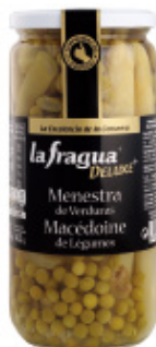
Código: 6298 Menestra de Verduras al Natural Extra Tarro-720 EAN13: 8436006916298