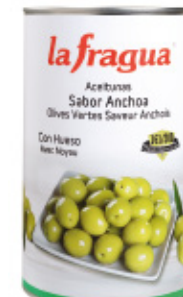
Código: 0722 Aceitunas Sabor Anchoa 161/200 l Lata 5 kg EAN13: 8436006910722