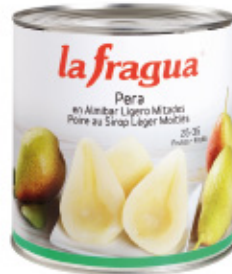
Código: 4706 Pera en Almíbar Ligero Mitades 25-35 l Lata 3 kg EAN13: 8436006914706