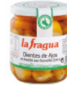
Código: 5673 Dientes de Ajos en Oliva con Guindilla Extra Tarro-370 EAN13: 8436006915673