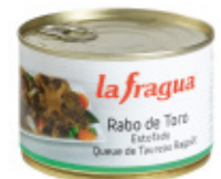
Código: 5376 Rabo de Toro Estofado Extra Lata 1/2 kg EAN13: 8436006915376