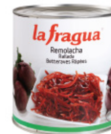
Código: 2948 Remolacha Rallada I Lata 3 kg EAN13: 8436006912948