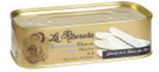
Código: 6267 Espárragos 6-8 l Lata 1/2 kg EAN13: 8436006916267