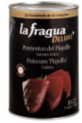
Código: 6380 Pimiento Piquillo Enteros Extra 18-22 Extra Lata 1/2 kg EAN13: 8436006916380