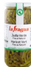
Código: 1002 Judía Verde Redonda-Fina al Natural Extra Tarro-720 EAN13: 8436006911002