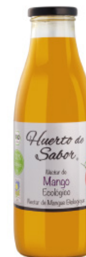
Código: 7059 Néctar de Mango Ecológico Botella 3/4 L EAN13: 8436006917059