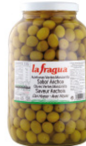
Código: 4676 Aceitunas Sabor Anchoa 161/200 l Tarro Galón EAN13: 8436006914676