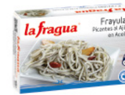
Código: 4133 Frayulas al Ajillo en Aceite Lata OL-120 EAN13: 8436006914133