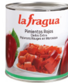
Código: 6885 Pimiento Morrón Dados Extra Lata 3 kg EAN13: 8436006916885