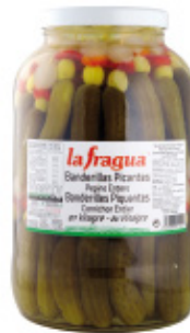
Código: 1521 Banderillas Picantes Pepino Entero I Tarro Galón EAN13: 8436006911521