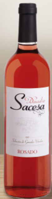
Código: 2849 Vino Rosado Botella 3/4 L. 13% Vol. EAN13: 8436006912849