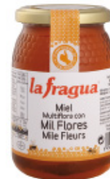
Código: 1248 Miel Mil Flores Tarro 1/2 kg EAN13: 8436006911248