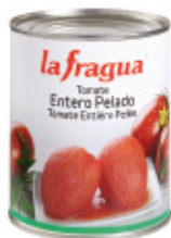
Código: 0210 Tomate Entero Natural I Lata 1 kg EAN13: 8436006910210