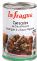
Código: 0524 Caracoles en Salsa Picante Extra Lata 1/2 kg EAN13: 8436006910524