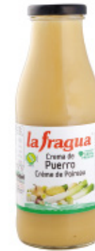
Código: 6755 Crema de Puerro Botella 1/2 L EAN13: 8436006916755