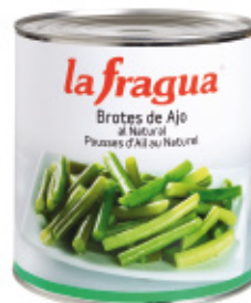
Código: 5932 Brotes de Ajos Verdes al Natural I Lata 3 kg EAN13: 8436006915932