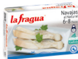
Código: 5420 Navajas 6-8 al Natural Lata OL-120 EAN13: 8436006915420