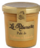
Código: 7158 Paté de Mejillones en Escabeche Tarro-100 EAN13: 8436006917158