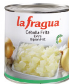
Código: 3068 Cebolla Frita en Aceite de Oliva Extra Lata 3 kg EAN13: 8436006913068