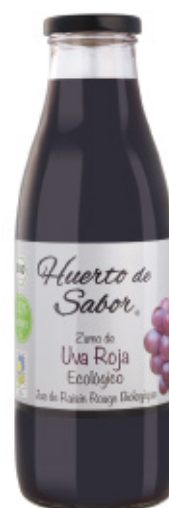
Código: 7127 Zumo de Uva Roja Ecológico Botella 3/4 L EAN13: 8436006917127