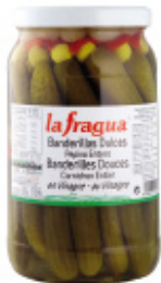
Código: 1439 Banderillas Dulces Pepino Entero I Tarro 1/2 Galón EAN13: 8436006911439