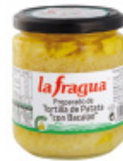
Código: 6120 Preparado de Tortilla de Patata con Bacalao Tarro-370 EAN13: 8436006916120