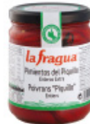
Código: 1453 Pimiento Piquillo Entero 19-24 Extra Tarro-460 EAN13: 8436006911453