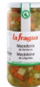
Código: 0906 Macedonia de Verduras al Natural Extra Tarro-720 EAN13: 8436006910906