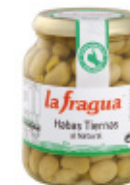
Código: 4478 Habas Tiernas al Natural I Tarro-370 EAN13: 8436006914478