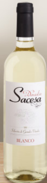
Código: 2856 Vino Blanco Botella 3/4 L. 11,5% Vol. EAN13: 8436006912856