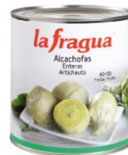
Código: 1729 Alcachofa Entera 40-50 Extra Lata 3 kg EAN13: 8436006911729