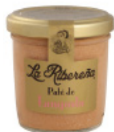
Código: 6700 Paté de Langosta Tarro-100 EAN13: 8436006916700