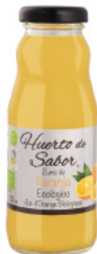
Código: 7356 Zumo de Naranja Ecológico Botella 200 ml EAN13: 8436006917356