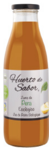
Código: 7097 Zumo de Pera Ecológico Botella 3/4 L EAN13: 8436006917097