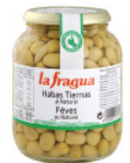
Código: 3174 Habas Tiernas al Natural I Tarro-720 EAN13: 8436006913174