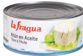
Código: 4010 Atún en Aceite Lata RO-900 EAN13: 8436006914010